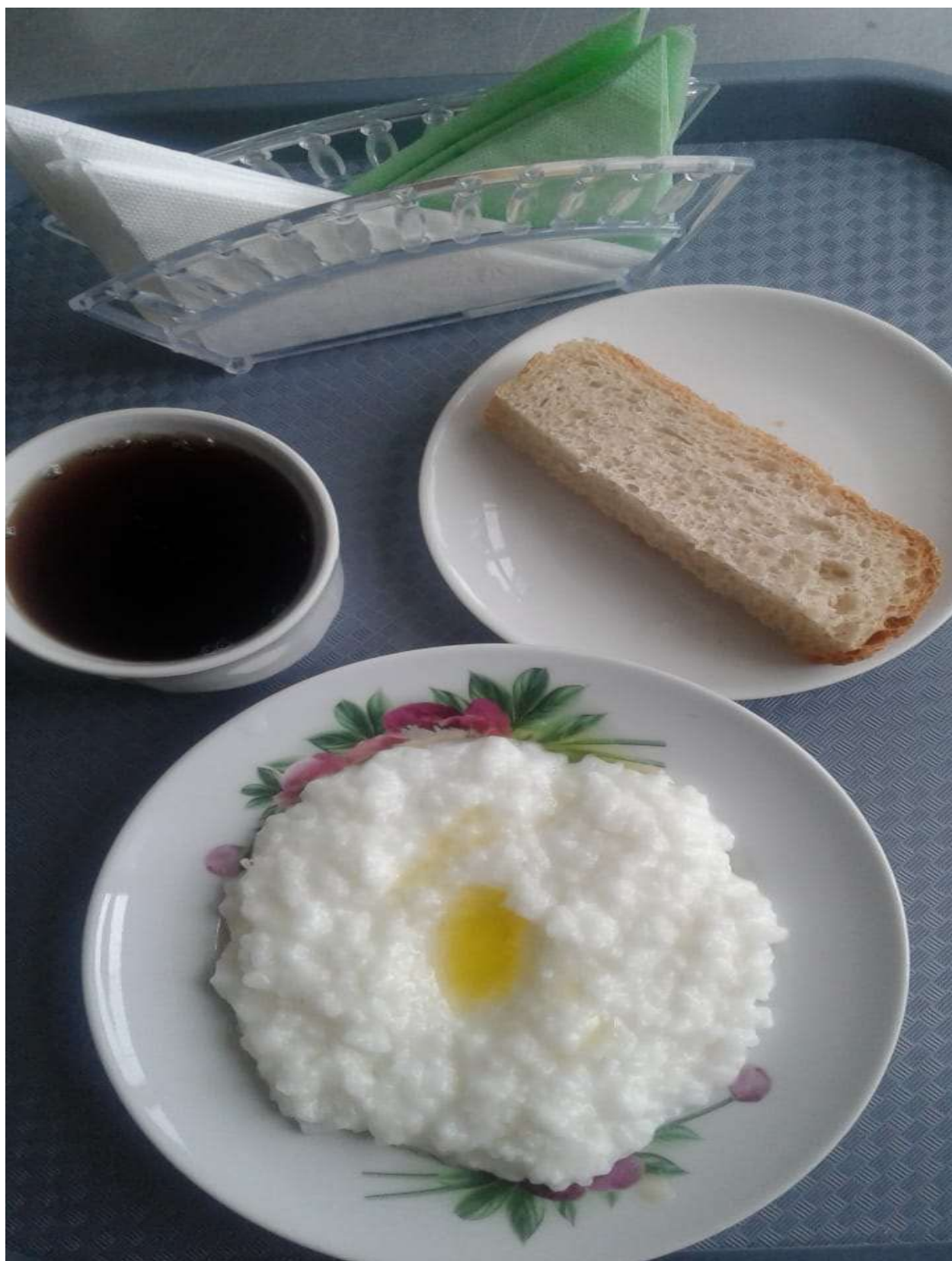
Завтрак родительский взнос